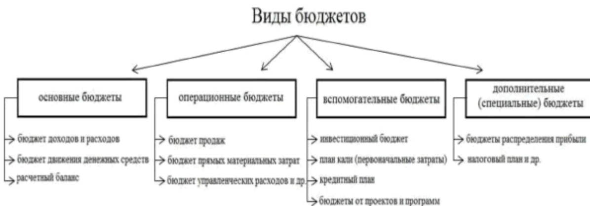
Рис. 1. Виды бюджетов организации

В основу бюджетирования положена разработка разных видов планов (бюджетов), которые являются одним из основных инструментов при управлении компанией. Бюджет предприятия выступает высокоэффективным инструментом при внутрифирменном финансовом планировании и позволяет оперативно оценивать и координировать деятельность структурных подразделений организации. Применяемые в финансовом планировании виды бюджетов можно увидеть на рисунке 2.